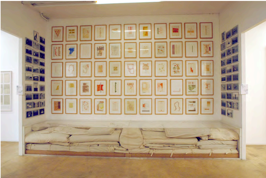
Franz Erhard Walther, Werklager (1961-1972), coll, MAMCO